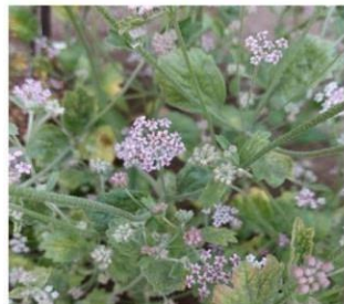
Homalocarpus dichotomus "Barba de gato"