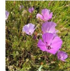
Clarkia tenella (morada) "huasita"