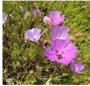
Clarkia tenella (morada) "huasita"