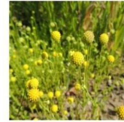
Helenium aromaticum "manzanilla de cerro"