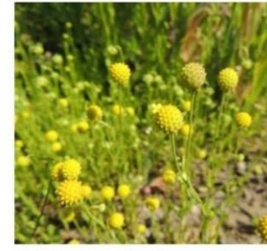
Helenium aromaticum "manzanilla de cerro"