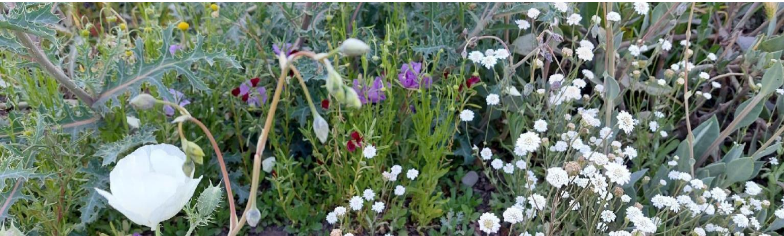
Mix Parque Bicentenario Vitacura 2024