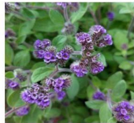
Phacelia brachyanta "flor de la cuncuna"