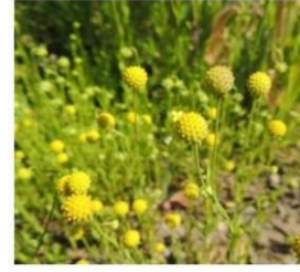
Helenium aromaticum "manzanilla de cerro"