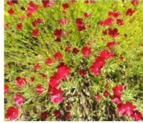
Clarkia tenella (roja) "sangre de toro"