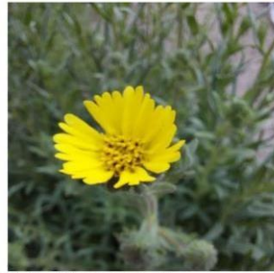
Madia chilensis "melosa"