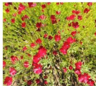
Clarkia tenella (roja) "sangre de toro"