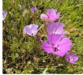
Clarkia tenella (morada) "huasita"