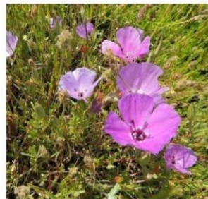
Clarkia tenella (morada) "huasita"