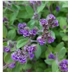
Phacelia brachyanta "flor de la cuncuna"