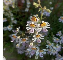
Schizanthus grahamii "mariposita"