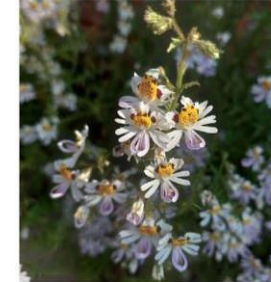
Schizanthus grahamii "mariposita"